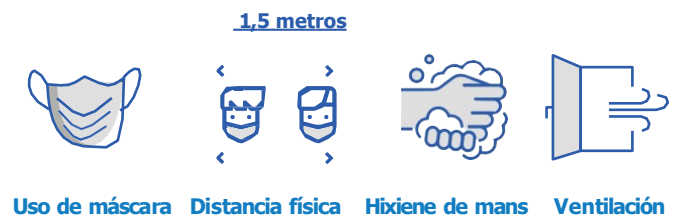
Uso de máscara Distancia física Hixiene de mans Ventilación

Aínda que un contacto estreito teña un resultado negativo no test da Covid-19, é obrigatorio gardar estritamente a corentena ou o período de vixilancia durante o tempo establecido.